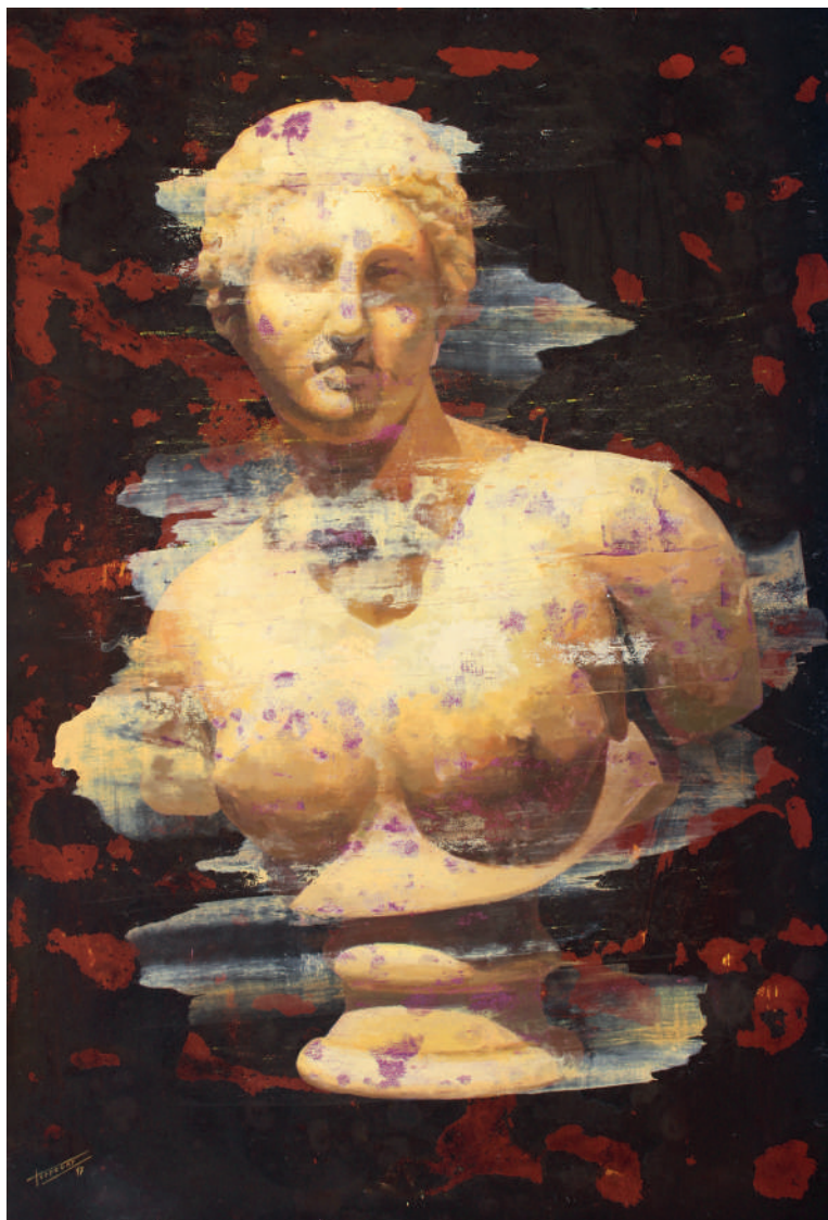
Busto de Venus