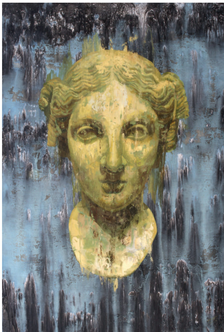
Cabeza de mujer