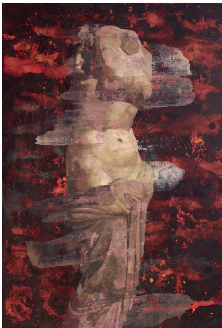
Venus de la concha