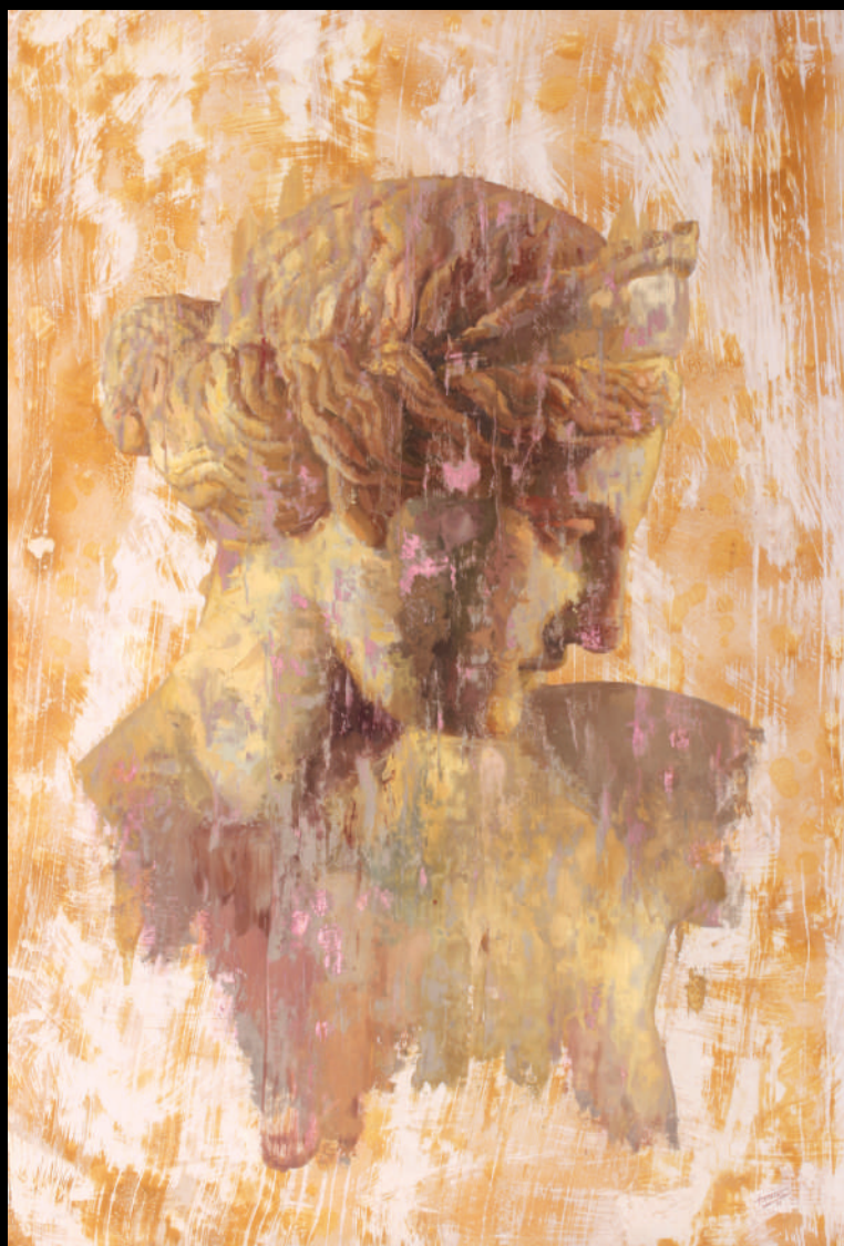
Venus de Capua I Técnica mixta sobre papel 112 X 76 cm