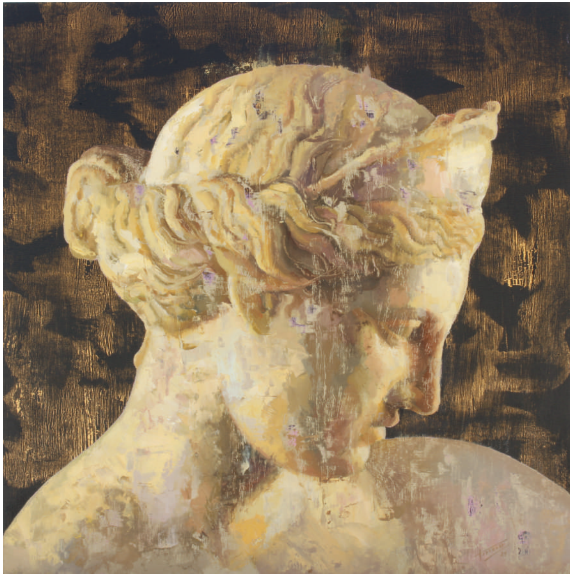
Venus de Capua I

Técnica mixta sobre madera entelada 50 x 50 cm