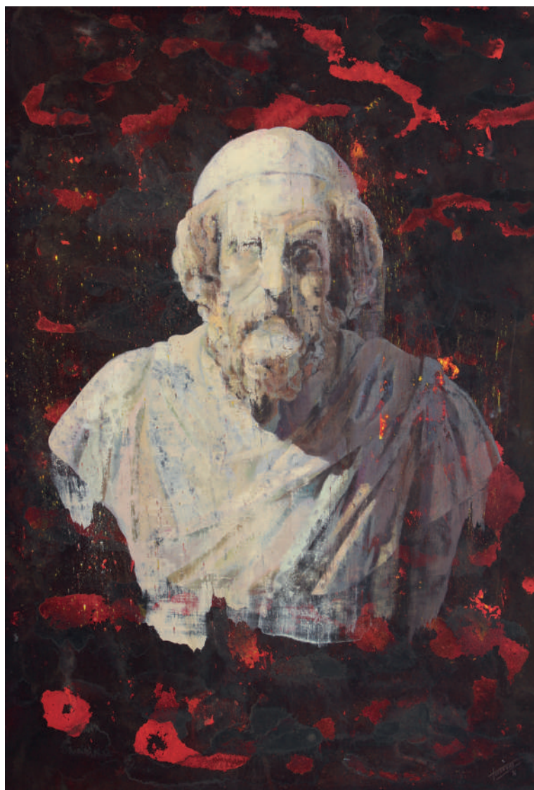
Busto de Homero