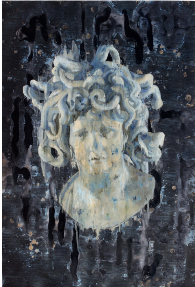
Cabeza de Medusa