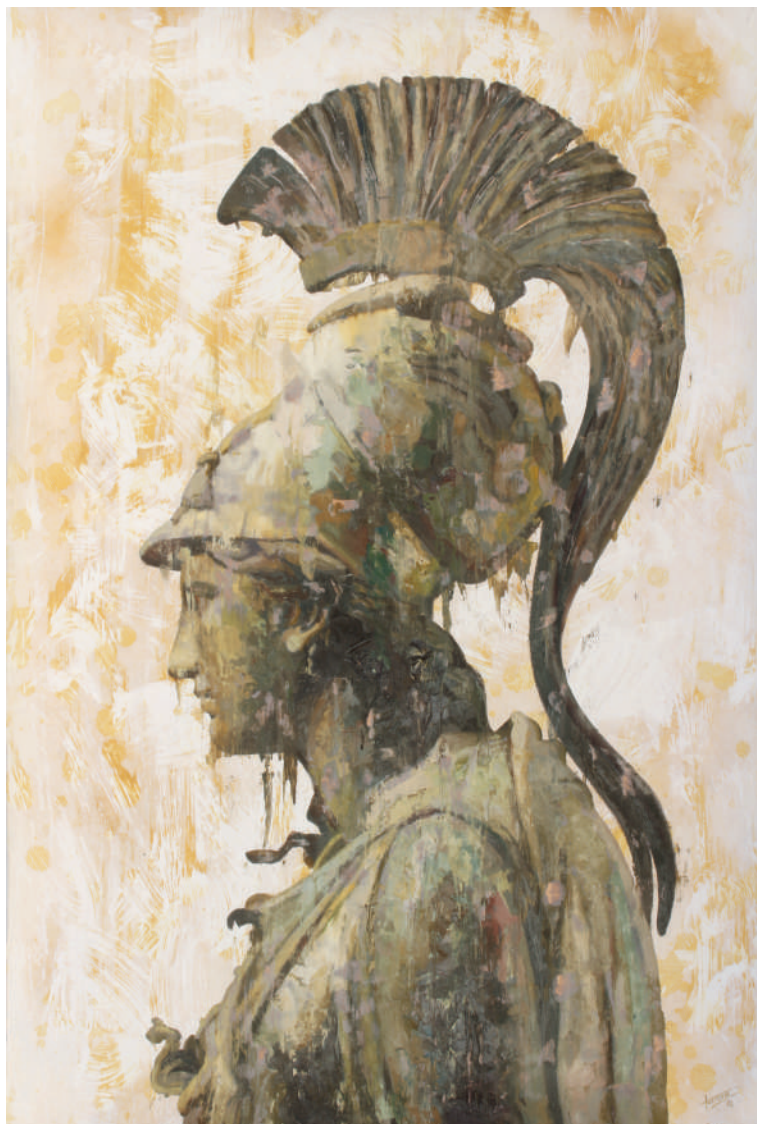
Busto de Zeus