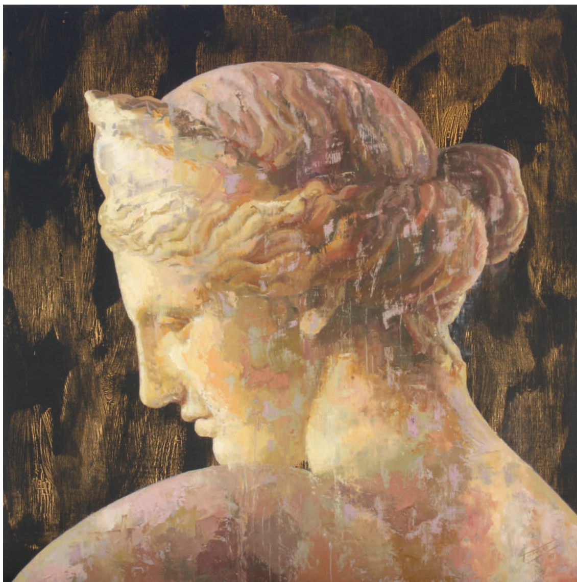
Venus de Capua II

Técnica mixta sobre madera entelada 50 x 50 cm